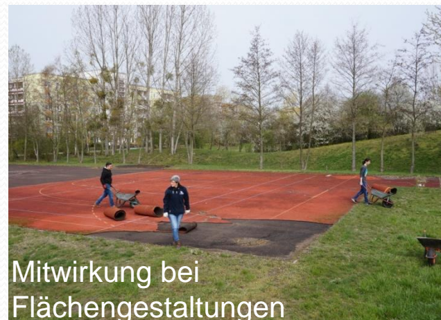
Mitwirkung bei Flächengestaltungen